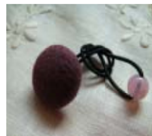
おまけのヘアゴム